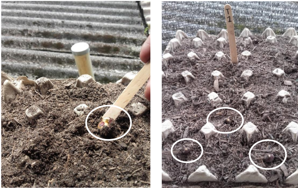
Imagen 15: emergencia de la plúmula.