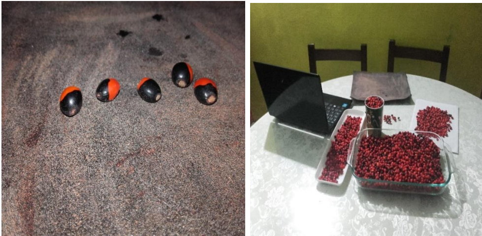
Imagen 10,11: Semilla con proceso de lijado

Se procede al lavado de la semilla para dejar retirar las impurezas como polvo y vestigios del fungicida utilizado para la conservación de la semilla. Posteriormente se realizara el respectivo secado para realizarles el tratamiento. Este consistió en un Lijado con lija número 80, este se realizó sobre los cuatro (4) lados de la semilla con el fin de estimular la semilla con mayor rapidez, sacándolas del estado de latencia.