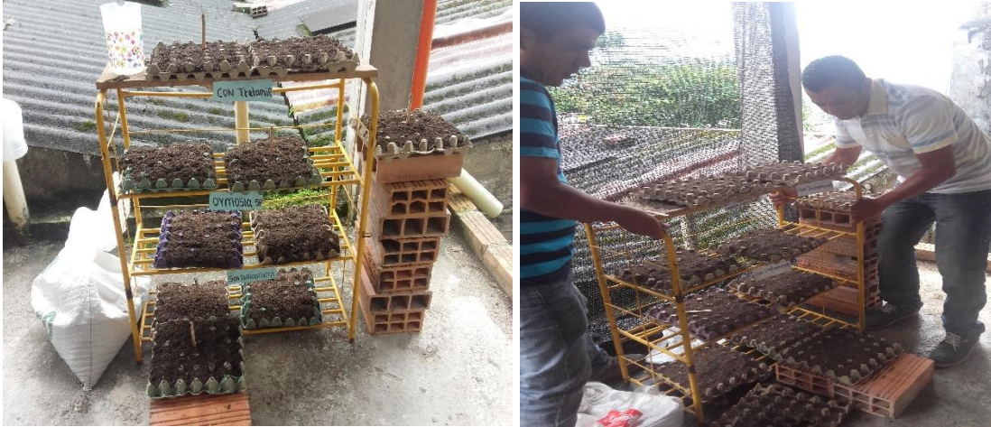
Imagen 3,4: Germinador

Para la germinación de las semillas de Chocho ( Ormosia sp ), se realizara la construcción de germinadores a base de paneles de cartón e incluyendo una base metálica tubular como soporte para los paneles de germinación.