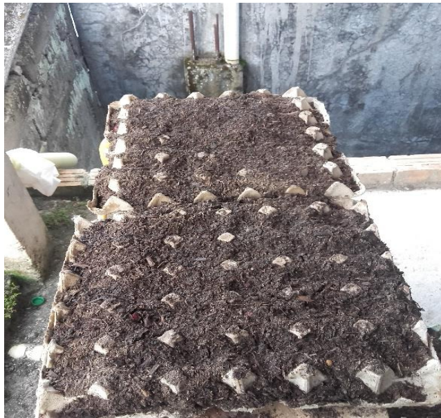
Imagen14: Camas de germinación

La siembra se realizó colocando las semillas de forma lateral con el objetivo de presenciar la emergencia de las radículas en las semillas.