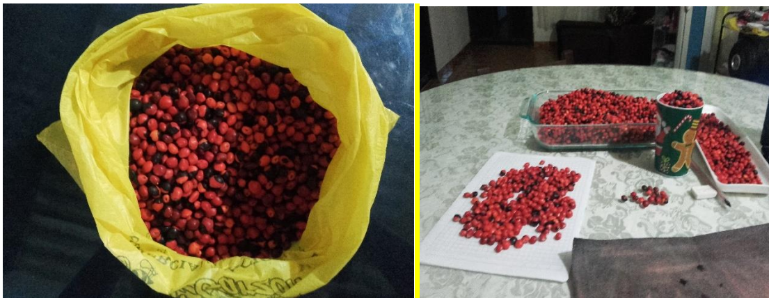
Imagen 1,3: Semillas de Chocho ( Ormosia sp )

La semilla de chocho ( Ormosia sp ) se conservan almacenadas a una temperatura ambiente en bolsas plásticas para proteger los granos o semillas contra insectos y patógenos, conservando su viabilidad hasta el momento de la siembra.