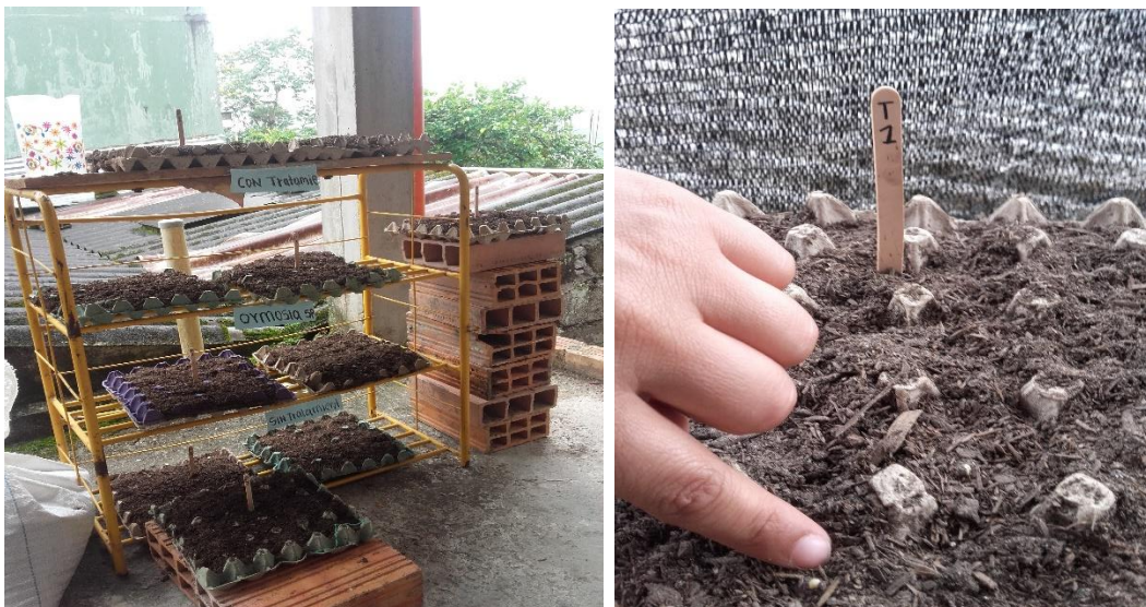
Imagen 8,9: Replicas