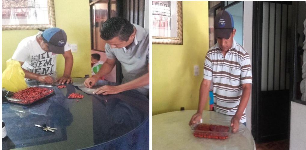
Imagen 6,7: Lijado e infusión en agua

una intensidad de campo de 30 y 60 militeslas y con Corriente continua, con una intensidad de campo de 30 y 60 militeslas.