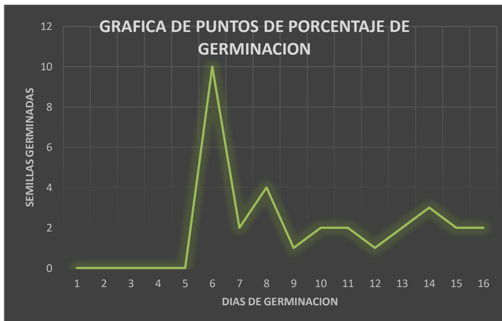
Grafica 1: Porcentaje de Germinación frente a los factores de los dos tratamientos.

T i = tiempo en días, para la germinación en el i-ésimo día.