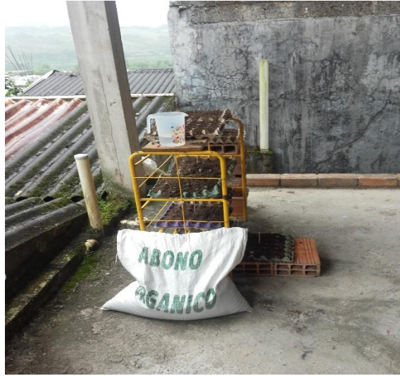
Imagen 5: Sustrato