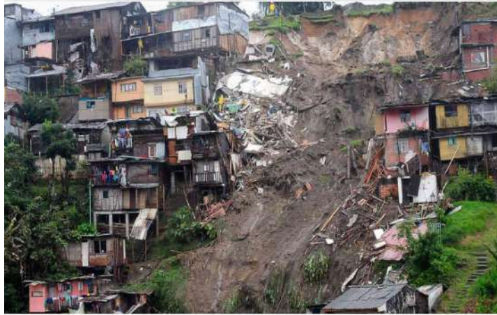
Figura 3. Deslizamiento de tierra en Manizales.

En enero de 2018 la vía que conduce a la ciudad de Villavicencio se vio interrumpida por cuenta del desplome de tierra por motivo de la intensidad de lluvia que aceleró el desprendimiento de la montaña que bloqueó esta importante vía, donde generó un impacto económico muy fuerte para los productores y turistas (Semana, 2019, pág. 1).