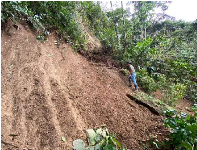
“Figura 5. Recorrido sobre el cuerpo del deslizamiento. Fuente Propia: abril 2020”