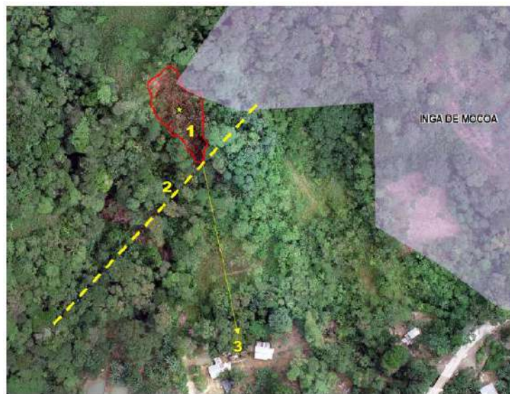
Figura 4. Vista aérea del deslizamiento Vereda El Líbano. Fuente: (Chindoy , Rodriguez, Zambrano , Rosero, & Davila, 2020, pág. 10)

Esta investigación se realizará en la vereda el Líbano localizada al noroeste de la cabecera Municipal de Mocoa departamento del Putumayo con coordenadas, 1^{\circ}8'43,607''N – 76^{\circ}40'22,48''W (ORDOÑEZ, 2020, pág. 1).