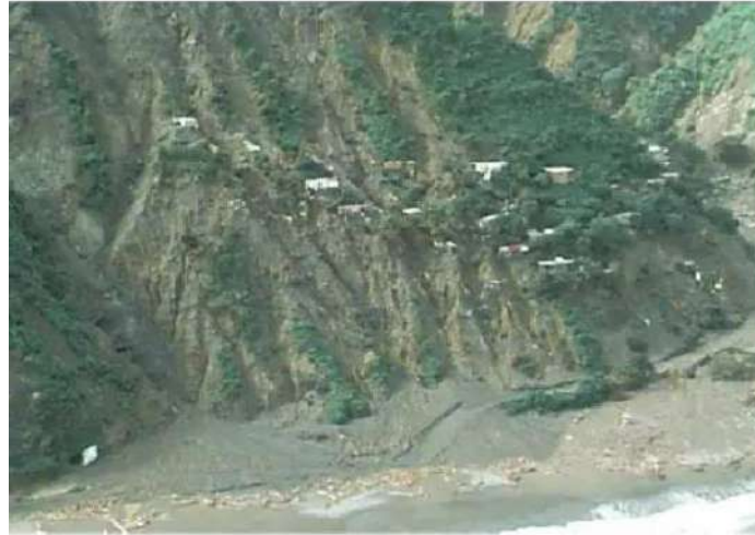
Figura 2. Deslizamiento en Lima Perú.

mexicanos” (p. 25) desarrollaron las metodologías actuales para el análisis de taludes de obras portuarias, que están sujetos a fuerzas gravitacionales, hidráulicas y de sismo. (Coppin, 2009) en su trabajo “Estabilidad de Taludes” (p. 2) trata sobre los diversos métodos para estabilizar un talud, establecen medidas de prevención y control para reducir los niveles de amenaza y riesgo.