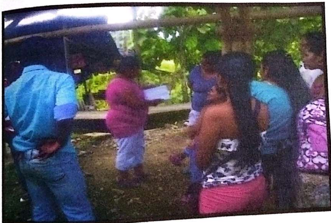
Fotografía 4. Primera Capacitación con la comunidad