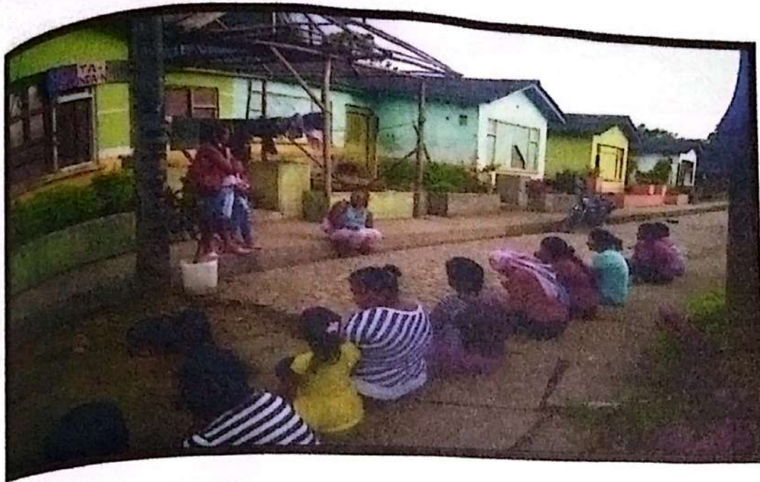
Fotografía 3. Socialización del proyecto ante la comunidad